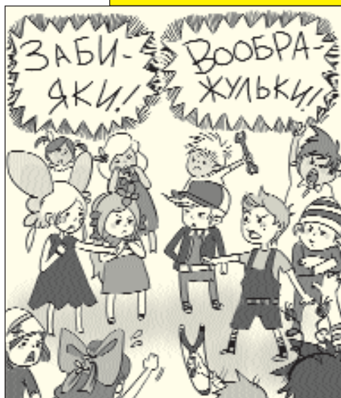
Рисунок Кристины Звездинской

– По какой схеме он построен? Почему? Что узнаем про героев?